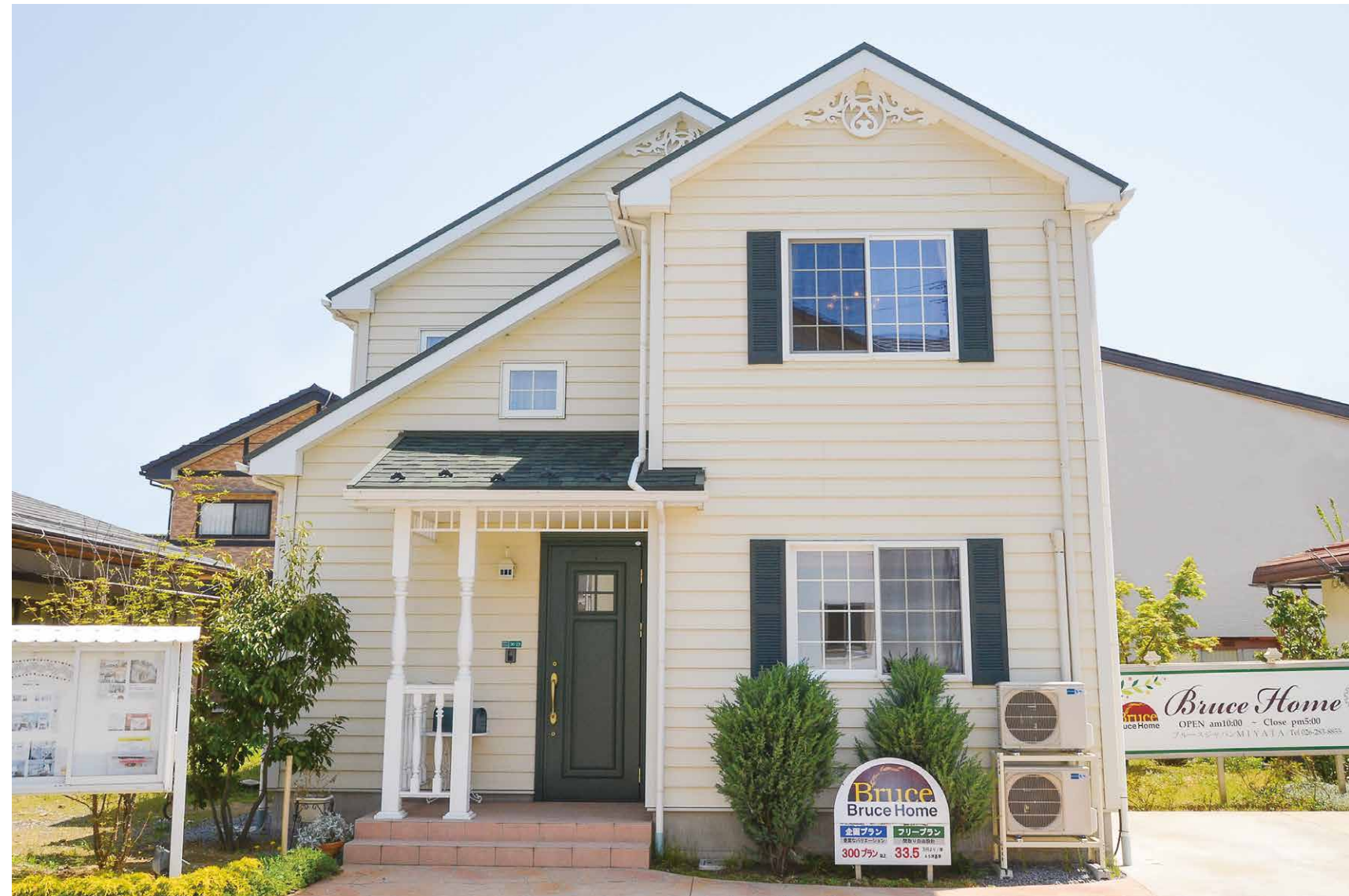
【長野市稲里モデルハウス】英国の住まいをルーツとする北米スタイルと威風堂々とした佇まいはあたたかさに包まれたテイスト