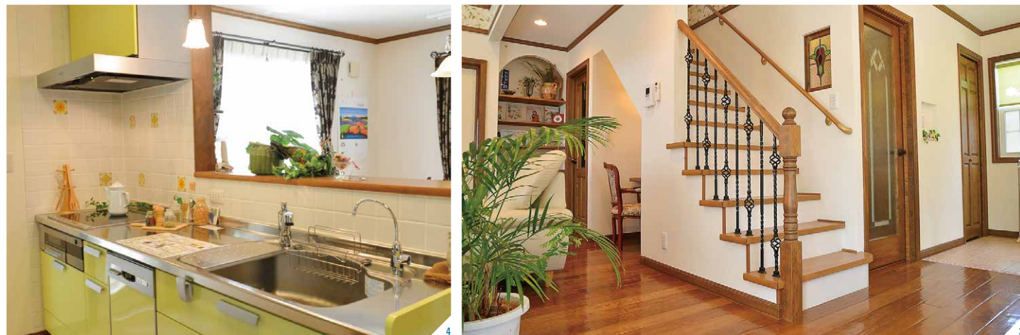
1.暮らしやすさと飽きのこない質感を重視する同社の家づくり。多様な輸入住宅を全国規模で提供しているだけに提案力も高い 2.リビング上の吹き抜けは、南側にキャットウォークを配し、部屋干しのスペース等にも活用する 3.オリジナルのアイアン手摺とアンティークフロアが美しさを際立たせる 4.グリーンカラーのキッチン。格子入りタイプのサッシ、木製の内窓枠など標準で高性能な仕様が魅力