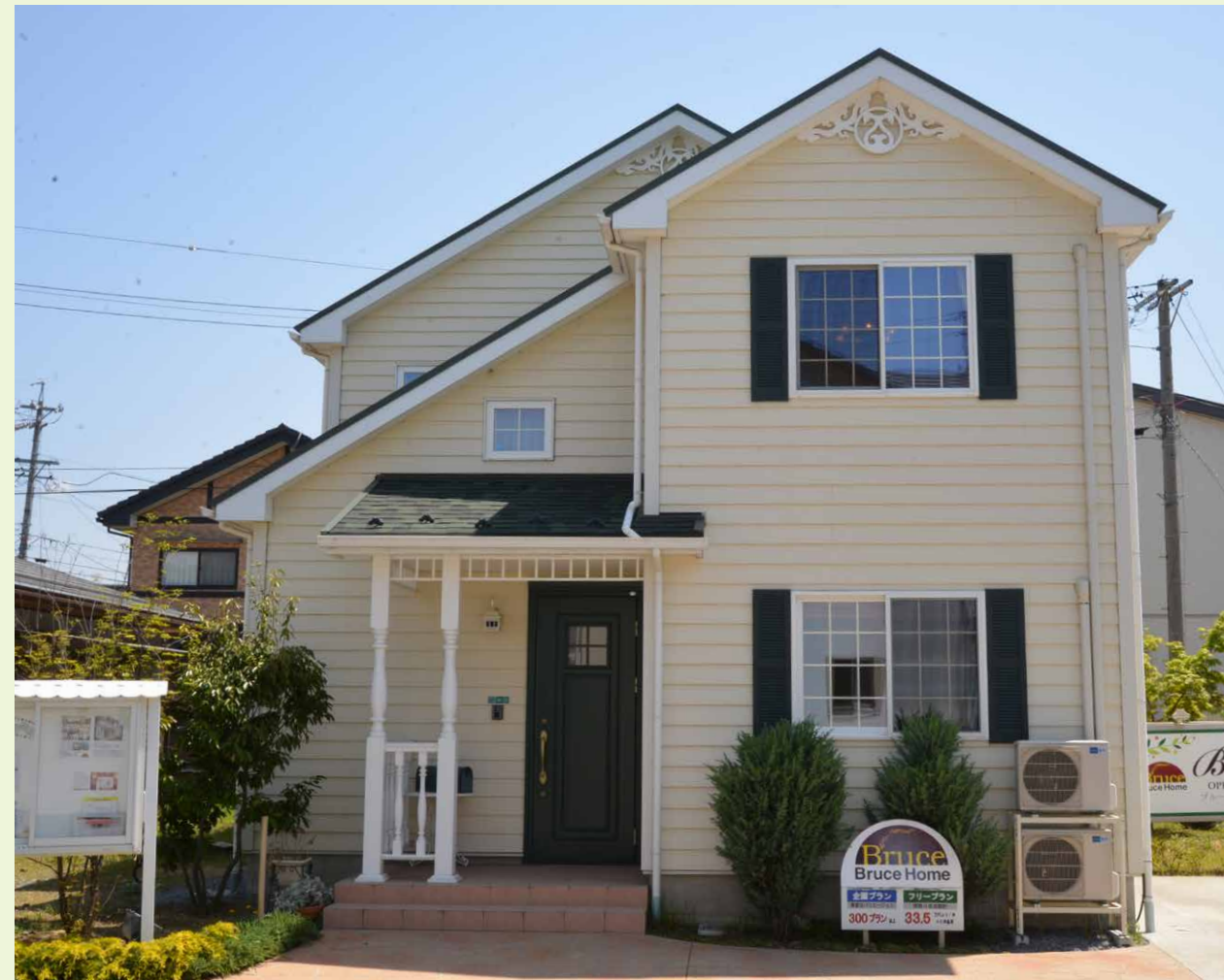
【長野市稲里モデルハウス】オールドプロヴァンスやスカンジナビアネイトと並び、人気のオレゴンシリーズをベースとしたモデルハウス。英国の住まいをルーツとする北米スタイルと威風堂々とした佇まいはあたたかさにも包まれたテスト。グリーン屋根と質感の高いラップサイディングは、一見の価値あり