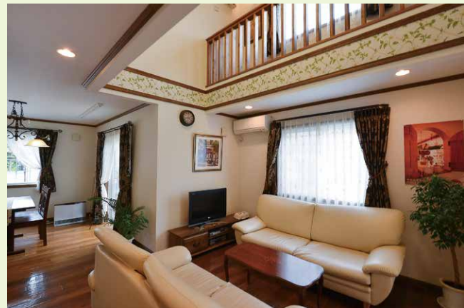
【長野市稲里モデルハウス】リビング上の吹き抜けは、南側にキャットウォークを配し、部屋干しのスペース等にも活用する。見た目にも高級感がプラスされる