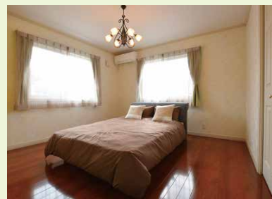
【長野市稲里モデルハウス】寝室は、廊下とキャットウォークどちらにも続いている間取り。クローゼットの扉や室内ドアも標準で上質な仕様を提案している