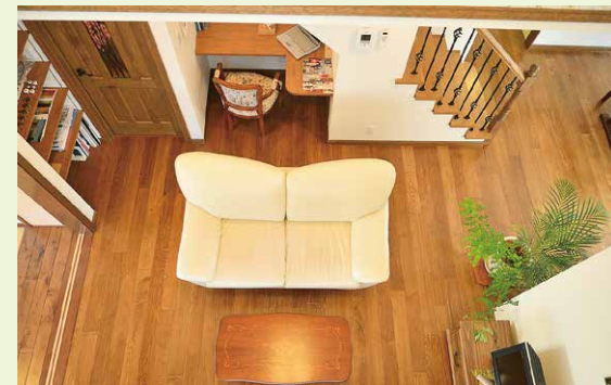
【長野市稲里モデルハウス】キャットウォークを設置した吹き抜けのリビング。写真右上へつながるキッチンはハイタイプのカウンターとし、水音漏れに配慮