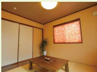
【長野市稲里モデルハウス】和室は2枚の襦を広げればフルオープンとなり、リビングとつながる。シーンに合わせて使えるように設計される