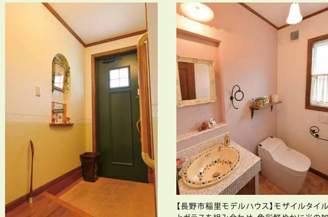
【長野市稲里モデルハウス】玄関扉は、建物のアクセントとしてグリーンを各部に使う 【長野市稲里モデルハウス】モザイルタイルとガラスを組み合わせ、色彩鮮やかに光の加減によりキラキラと輝く洗面台。小物一つひとつのディテールも「可愛い」が満載