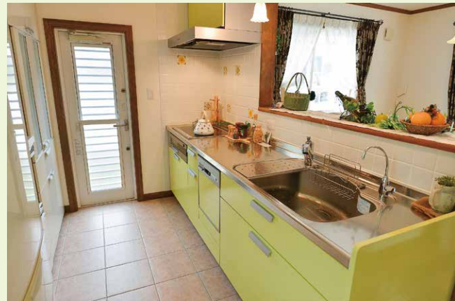
【長野市稲里モデルハウス】キッチンもグリーンのカラーをセレクト。格子入りタイプのサッシ、木製の内窓枠など標準でこの仕様であることが嬉しい