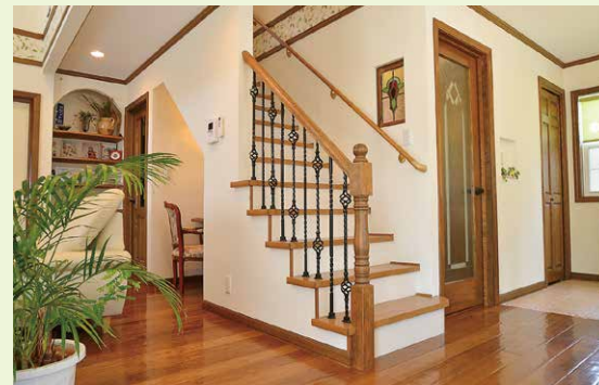
【長野市稲里モデルハウス】オリジナルのアイアン手摺とアンティークフロアが美しさを際立たせる。写真奥へつながる和室はブルースエコウォールなる吸湿に優れた壁材で仕立てる