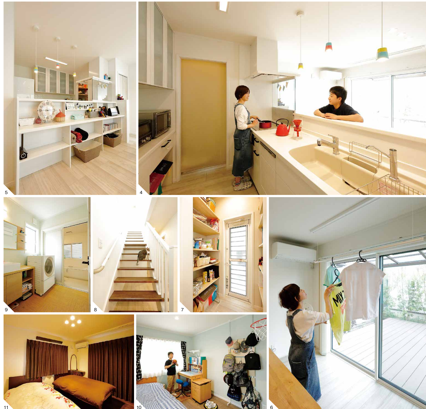
4.リビングダイニングと統一し、キッチンも白を基調にコーディネート。大きなシンクは洗剤などをしまえるポケット付き。ダストボックスの場所も計算されており、生活感を隠しつつ家事効率をアップ 5.キッチンカウンターのダイニング側は、収納も兼ねたスタイル 6.2階にもバルコニーや室内干しユニットがあるが、1階にランドリールームがあるためダイニングに干すことがほとんど。「東南面に陽当たりが良く、すぐ乾くので助かります」 7.キッチンに隣接したパントリー。両サイドに可動棚が5段ずつあるほか、床下収納まで完備 8.ナチュラルなデザインのスリット階段はキッチンの隣。踏み面は幅も奥行きもあり、上り下りしやすい 9.水回りはキッチンの裏側にあたり、短い家事動線でラクラク。脱衣室の床は調剤のフロアタイルを貼った 10.バスケ部キャプテンを務める長男の部屋。爽やかなクロスがポイント 11.白×ブラウンでシックにまとめた主寝室(7.3帖)。窓の上部に設けた読書用の間接照明は、手元で調整できる。バルコニーへとつながる窓辺に、巻上型の室内干しユニットも備えている