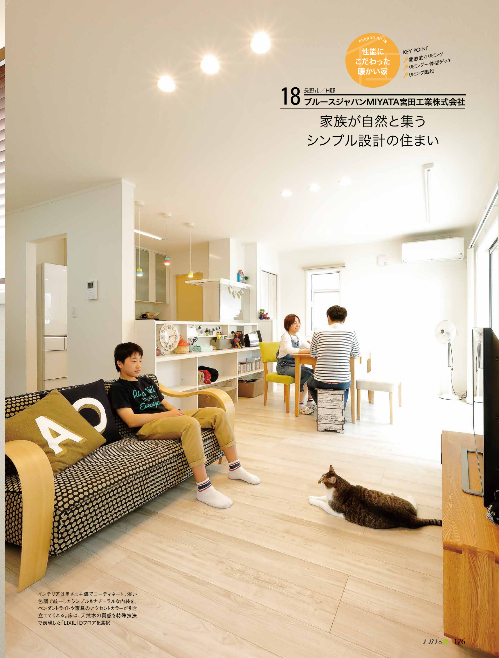
インテリアは奥さま主導でコーディネート。淡い色調で統一したシンプル&ナチュラルな内装を、ペンダントライトや家具のアクセントカラーが引き立ててくれる。床は、天然木の質感を特殊技法で表現した「LIXIL」Dフロアを選択