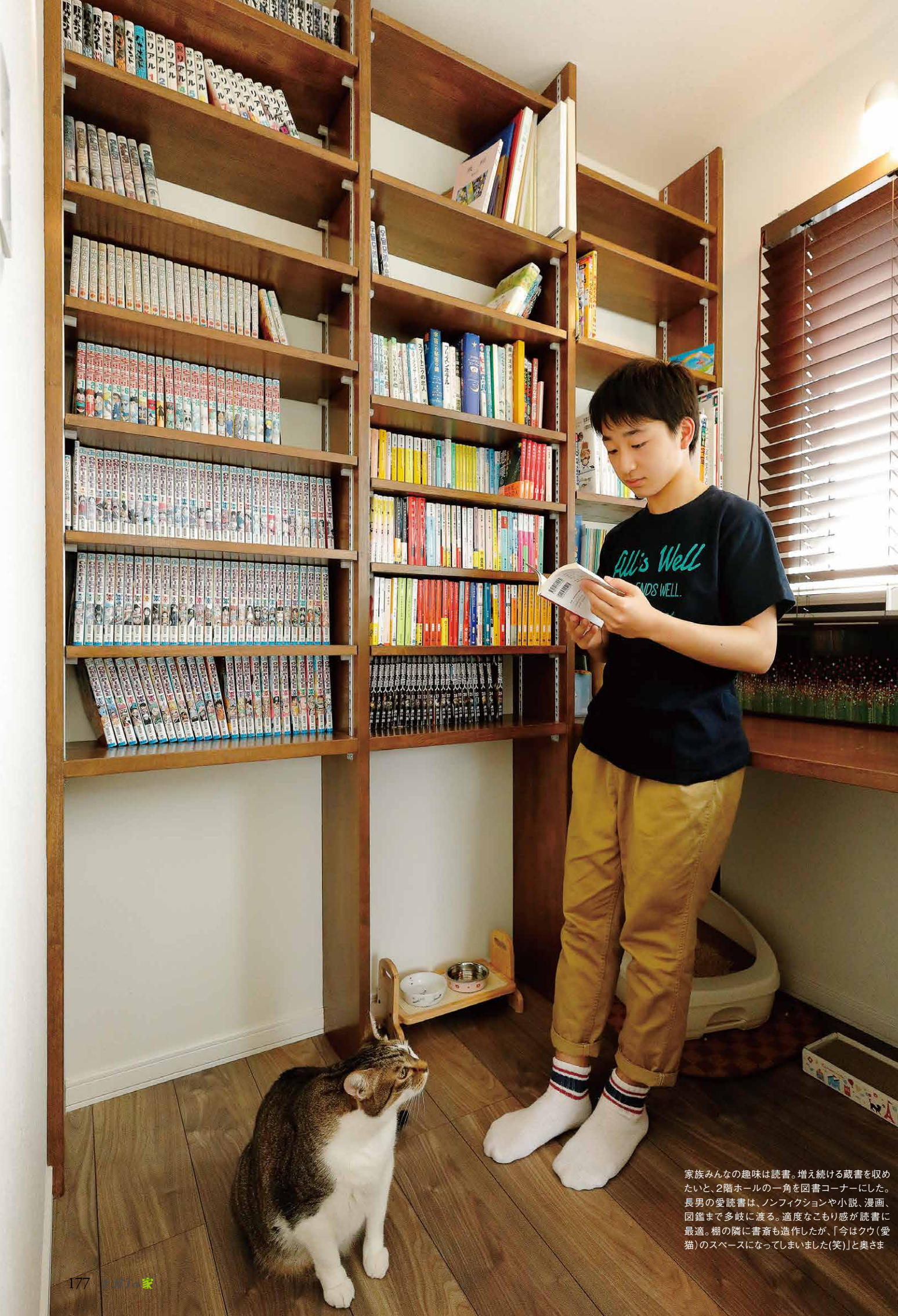
家族みんなの趣味は読書。増え続ける蔵書を取めたいと、2階ホールの一角を図書コーナーにした。長男の愛読書は、ノンフィクションや小説、漫画、図鑑まで多岐に渡る。適度なこもり感が読書に最適。棚の隣に書斎も造作したが、「今はクウ(愛猫)のスペースになってしまいました(笑)」と奥さま