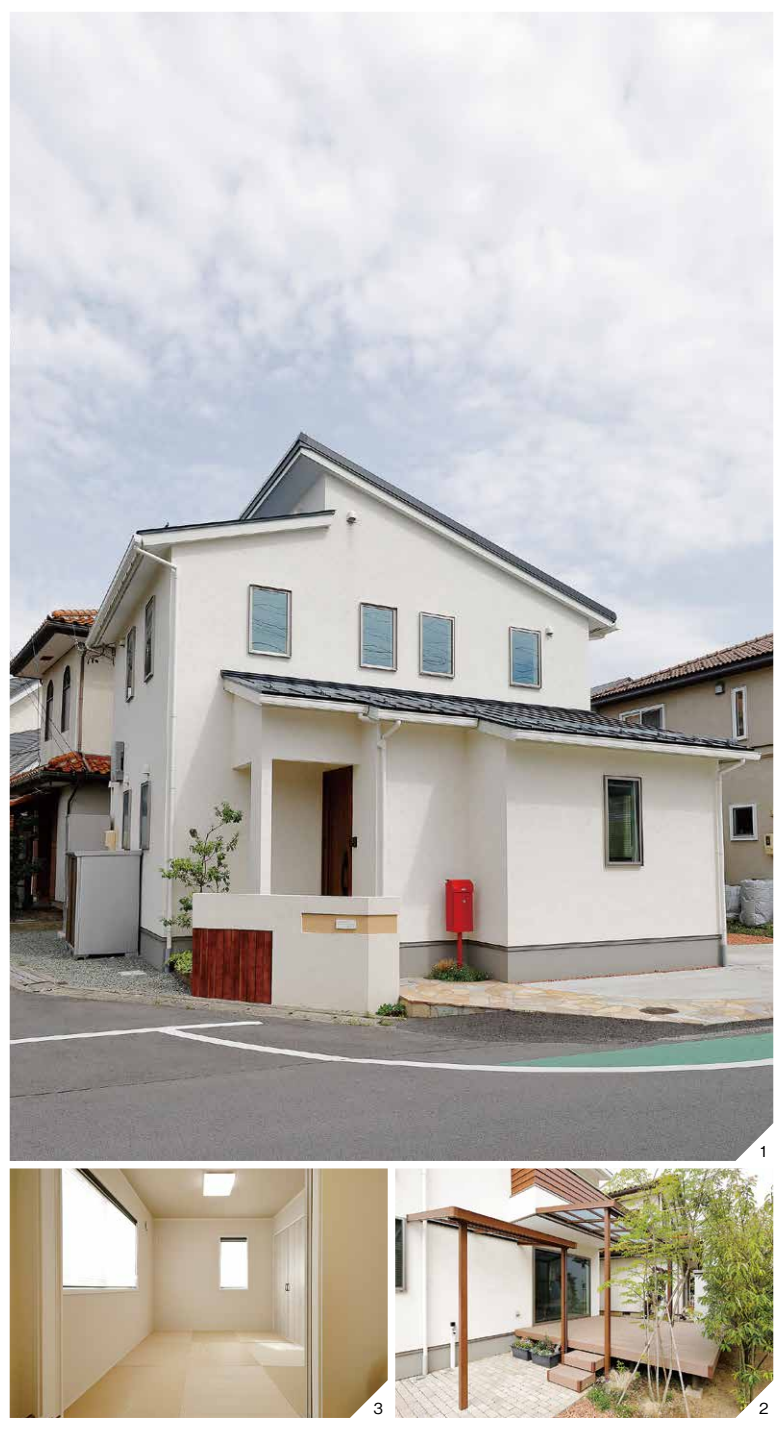
1.屋根に約5kWのソーラーパネルを搭載するためのシャープな屋根形状がモダンさを加えているH邸。一部に木をあしらった玄関ポーチの袖壁と、真っ赤なポストがアクセント 2.室内の床と高さをそろえたルーフ付きウッドデッキは、窓を開放すればリビングの一部に。メンテナンス性を考え、経年劣化の少ない人工木をセレクト 3.ゲスト用にと用意した1階和室。和紙を使った琉球畳は、ダニやカビが発生しにくく、撥水性が高いので掃除も簡単

18 HOUSING DATA 家族構成/夫、妻、長男、猫1匹 施主/39歳・会社員 施工会社の検討期間/約3カ月 検討した会社数/1社 工期/約4カ月 竣工/2015年12月 構造・工法/2×4 土地/新規購入(約46.81坪) 延床面積/88.60㎡(26.80坪) 1F/52.17㎡(15.78坪) 2F/36.43㎡(11.02坪) 施工・施工/ ブルースジャパンMIYATA宮田工業株式会社 ☎026-285-6061 関連情報→P320